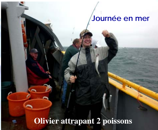
Journée en mer